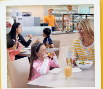
Special für Mamas

24.09. - 29.10.2021 Kommt freitags zusammen mit einer befreundeten Mama und spart pro Mama jeweils 4 € auf den Eintrittspreis